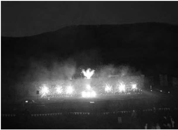
Musikgesteuertes bengalisches Feuerwerk nach "Das große Tor von Kiew" von M. Mussorgsky

Sehr geehrte Leserinnen und Leser, sehr geehrte Abonnenten, die Redaktions-Gruppe des Schönberg-Boten wünscht Ihnen und Ihren Familien ein gesundes und gutes neues Jahr!