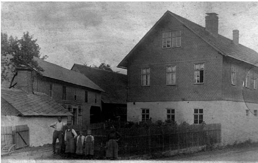
Hofanlage in Zopten um 1910

Eltern einen Bauernhof, Familienbesitz seit mehr als 300 Jahren. In der Nachkriegszeit erlebte Zopten gewaltige Wanderungsbewegungen zwischen sowjetischer und amerikanischer Besatzungszone. An der damals noch als Demarkationslinie bezeichneten Grenze patrouillierten sowjetische Soldaten in loser Folge, später die ersten deutschen Grenzpolizisten. Deutsche Soldaten und deutsche Kriegsgefangene, Vertriebene aus dem Osten, Zwangsarbeiter, Schmuggler und Schieber wechselten illegal über die nur schwach bewachte Linie zwischen sowjetischer und amerikanischer Besatzungszone.