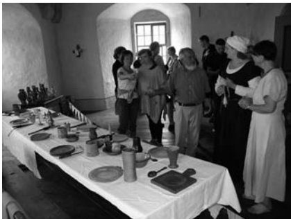
600 Jahre Kemenate Reinstädt, "Tafelkultur" - eine von 11 Erlebnisstationen am 17. August 2008