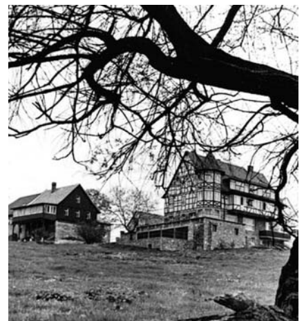
Martinsroda in den 70ziger Jahren

Als glückliche Fügung erwies es sich letztlich, dass auf dem Universitätsgut Martinsroda ein neuer Leiter gesucht wurde. Über Bekannte in Jena erfuhr man davon, bewarb sich und wurde angenom-